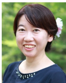
小野税務会計事務所 所長 税理士